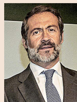
Juanjo Cano, presidente de KPMG.

Registra unos ingresos de 636 millones, un 7% más, duplicando el ritmo de crecimiento. La actividad de auditoría se acerca a los 200 millones de euros.