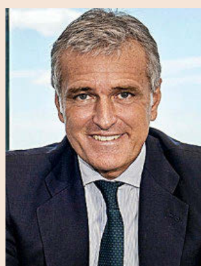
Gonzalo Sánchez, presidente de PwC.

Consolida su liderazgo como la mayor firma de servicios profesionales tras registrar la subida más fuerte de las 'Big Four' hasta los 975,2 millones de euros, un 9,5% más.